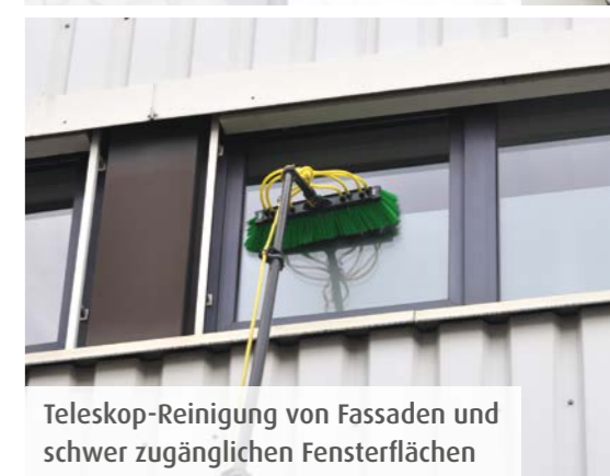
Teleskop-Reinigung von Fassaden und schwer zugänglichen Fensterflächen