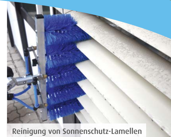
Reinigung von Sonnenschutz-Lamellen

Sie wünschen weitere Informationen? Nehmen Sie mit uns Kontakt auf, wir beraten Sie gerne!