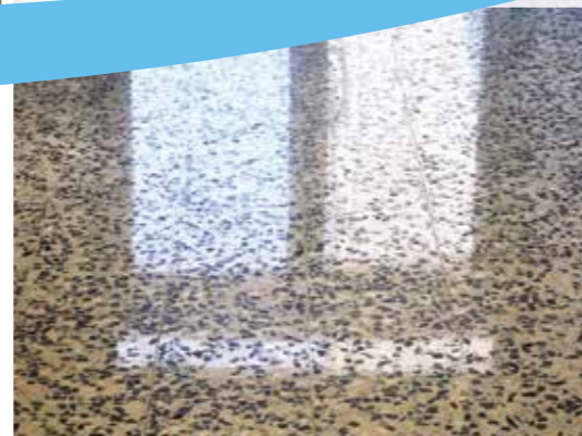
Betonwerkstein nach der Kristallisation

Dabei setzen wir verschiedene Verfahren vom Schleifen, Ausbessern, Polieren bis zum Kristallisieren, Imprägnieren und materialgerechten Reinigen ein. Laufstraßen und störende Verkantungen beseitigen wir durch Planschleifen – und durch den Nassschliff völlig staubfrei! Nach mehreren Schleifgängen glänzt die alte Steinfläche wieder in ganzer Schönheit. Zur Veredelung gehören auch die Ausbesserung kleiner Risse und Löcher, die Wiederherstellung der ursprünglichen Farbgebung, die Erhöhung der Trittsicherheit, die Kristallisierung kalkhaltiger Steinflächen und die Imprägnierung zum Schutz vor Fett- und Feuchtigkeitflecken. All dies bringt den Naturstein nicht nur zum Strahlen, sondern erleichtert auch die regelmäßige Reinigung.