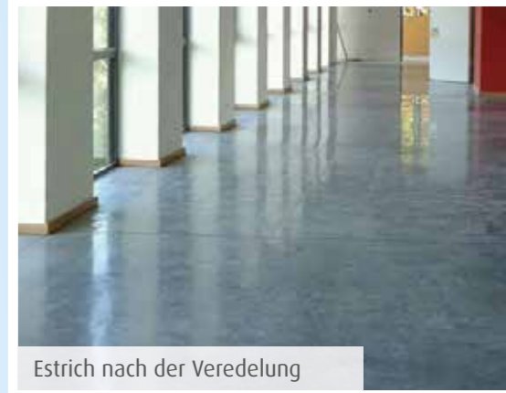
Estrich nach der Veredelung