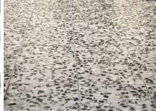
Betonwerkstein vor der Sanierung