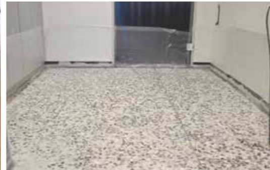
Betonwerkstein nach Abschleif